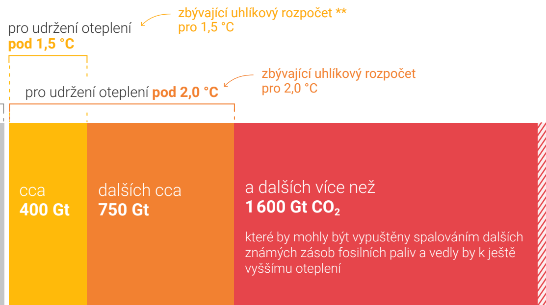
Globální emise CO 2 z dalšího spalování fosilních paliv